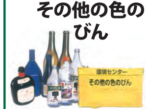
その他の色の びん