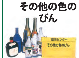
その他の色の びん