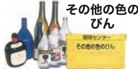
その他の色のびん