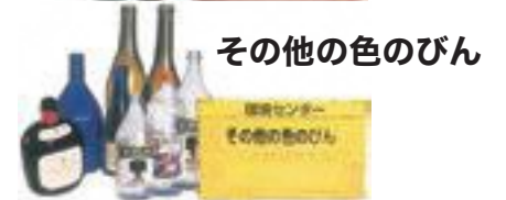
その他の色のびん